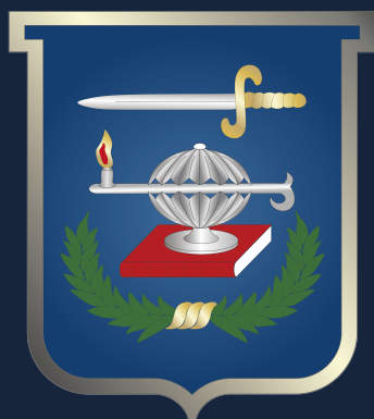
Escuela Superior de Guerra "General Rafael Reyes Prieto" Colombia